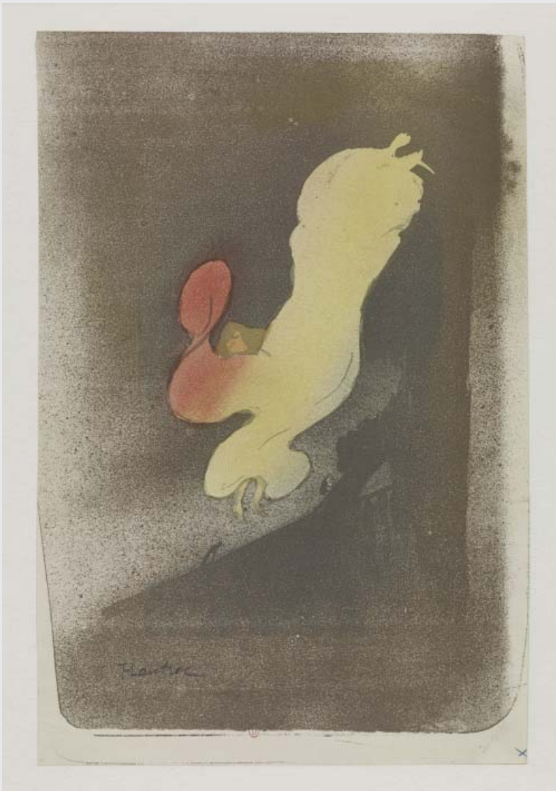
◀ 11 | Henri de Toulouse-Lautrec, Miss Loie Fuller 1893, lithographie au pinceau et au crachis, Paris, bibliothèque de l'INHA – collections Jacques-Doucet, cabinet d'estampes modernes