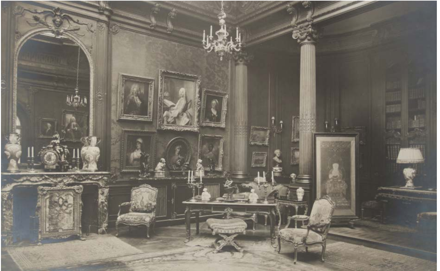
▲ 21 Grand salon de l'hôtel de la rue Spontini, où Jacques Doucet installa sa collection de sculptures xviii e et une partie de sa collection de peintures.