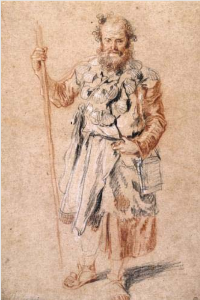
▲ 3 | Antoine Watteau, Le Pèlerin de Saint-Jacques , sanguine, pierre noire et rehauts de blanc sur papier chamois, c. 1715, Paris, musée des Beaux-Arts de la Ville de Paris, Petit Palais.