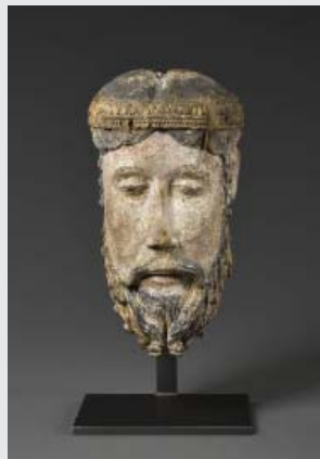
► 5 | [Anonyme français] Tête de Christ couronné, dit de Lavaudieu, 2 e quart du XI e siècle, Paris, musée du Louvre.