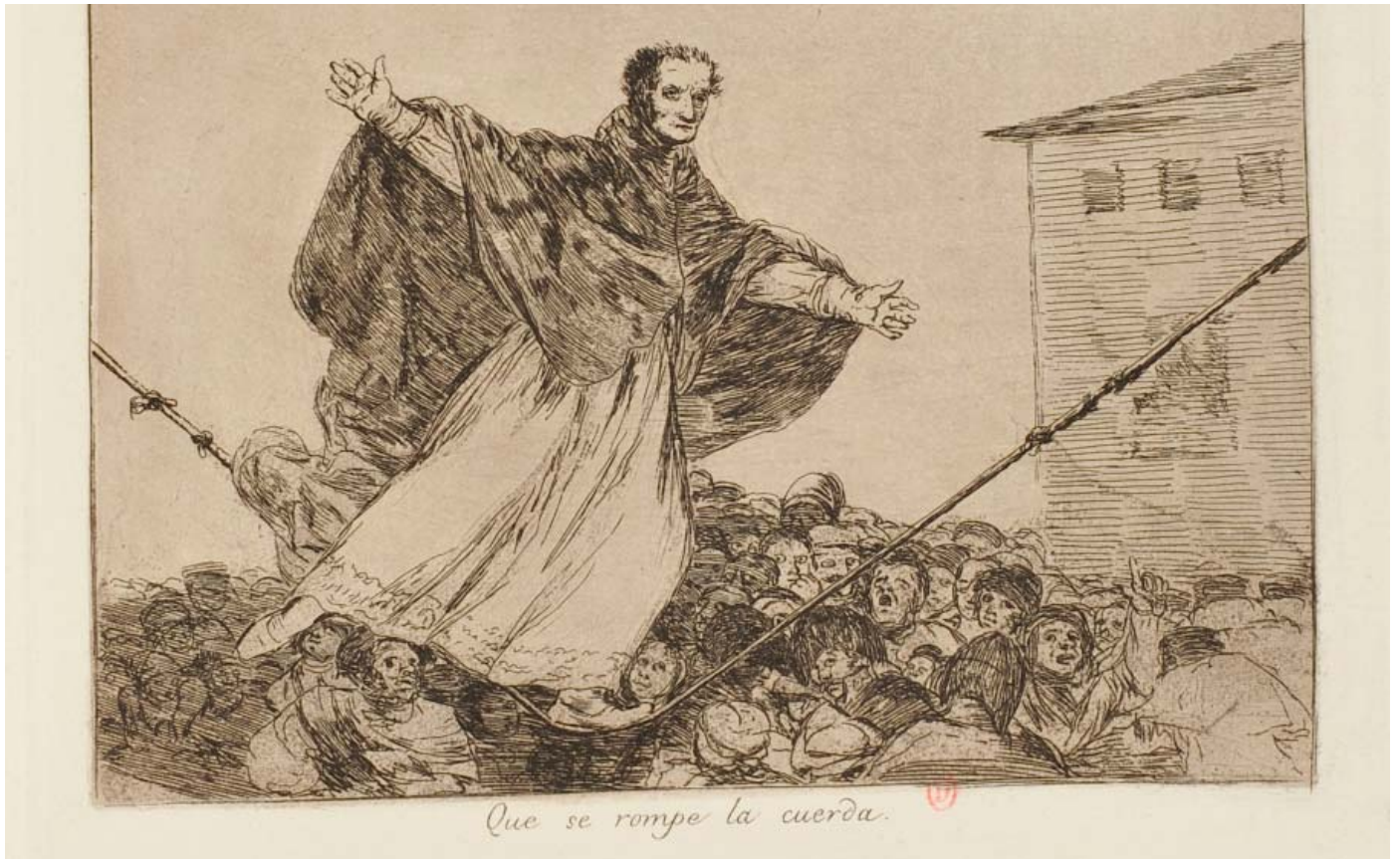
▲ 10 | Francisco de Goya, Les Désastres de la guerre , estampe réalisée après la mort de l'artiste, en 1863, Paris, bibliothèque de l'INHA – collections Jacques-Doucet