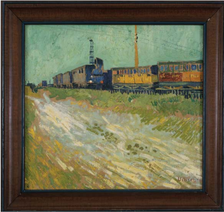
▲ 8 | Vincent Van Gogh, Wagons de chemin de fer , 1888, huile sur toile, Avignon, musée Angladon.