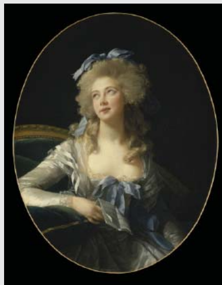
47 | Élisabeth Louise Vigée Le Brun, Madame Grand , 1783, huile sur toile, 92 x 72,4 cm, New York, The Metropolitan Museum of Art, legs Edward S. Harkness, 1940, inv. 50.135.2.