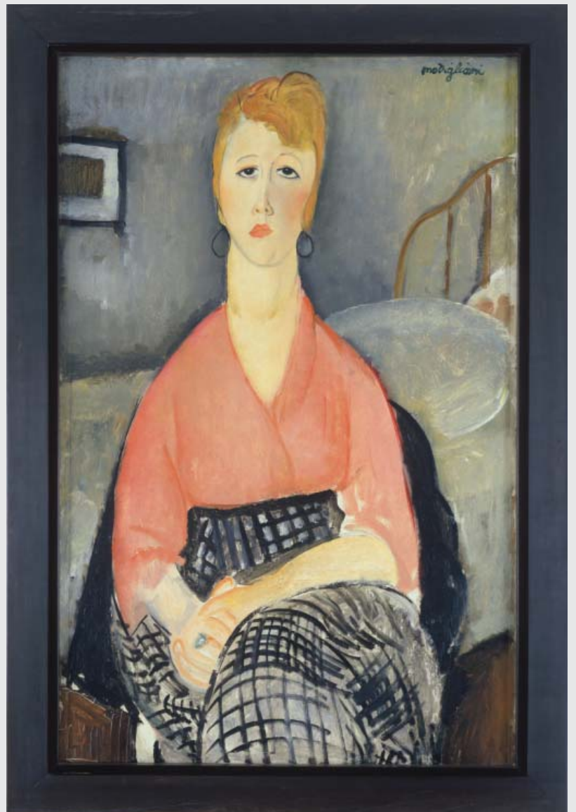
▼ 9 | A. Modigliani, La Blouse rose , 1919-1920, huile sur toile, Avignon, musée Angladon