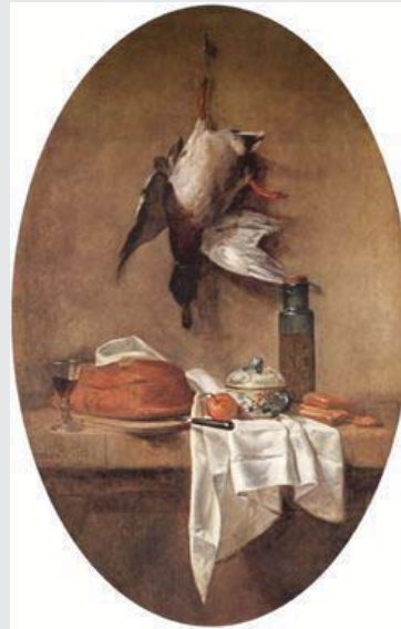
▼ 4 | Jean Siméon Chardin, Nature morte (Rafraichissements) , 1764, huile sur toile, 152 x 96,5 cm, Springfield, Mass., Michele and Donald D'Amour Museum of Fine Arts, The James Philip Gray Collection.