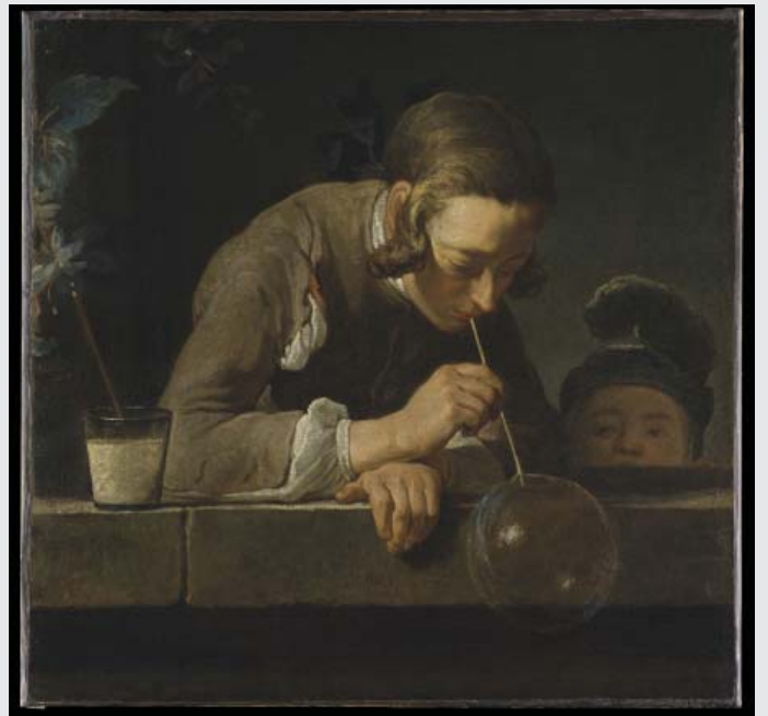
▲ 6 | Jean Siméon Chardin, Les Bulles de savon , c. 1733-1734, huile sur toile, 61 x 63,2 cm, New York, The Metropolitan Museum of Art, Wentworth Fund, 1949, inv. 49.24.